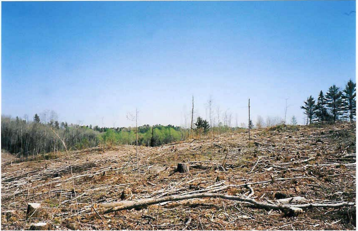
Le long de la rivière Noire en Outaouais, mai 2003

«Les forêts précèdent les Hommes ; les déserts les suivent.» Tiré du documentaire Mémoires de la Terre